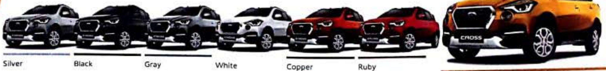
Silver Black Gray White Copper Ruby